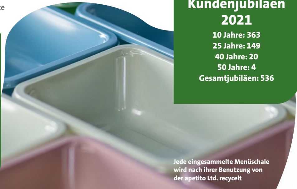
Jede eingesammelte Menüschale wird nach ihrer Benutzung von der apetito Ltd. recycelt

Kundenjubiläen 2021 10 Jahre: 363 25 Jahre: 149 40 Jahre: 20 50 Jahre: 4 Gesamtjubiläen: 536